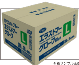
外箱サンプル画像